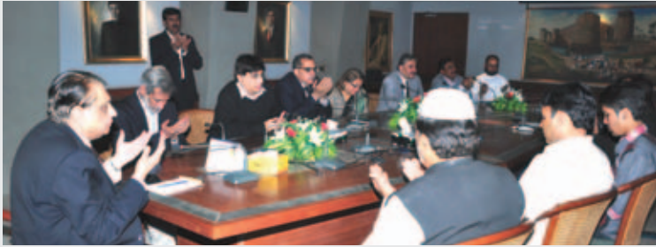
مرحوم کے ایصال ثواب کے لیے فاتحہ خوانی کی جا رہی ہے