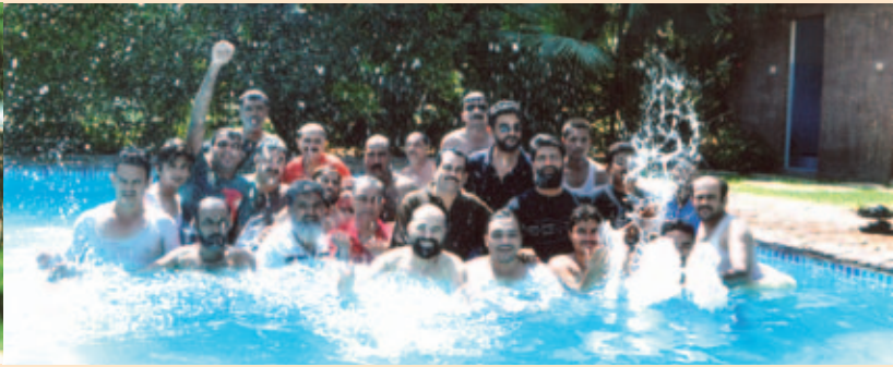
سوئمنگ پول میں نہانے کا ایک خوبصورت منظر

میں اپنی مثال آپ تھا۔ اس تفریحی دورے کو ایک سنگ میل قرار دیتے ہوئے ممبران کلب نے اس تسلسل کو جاری رکھنے کے عزم کی تجدید کی۔ دن بھر کی تفریح اور ٹھنڈے پانی سے لطف اندوز ہونے کے مصروف شیڈول کے بعد اگلے روز کی شام تک پکنگ کے یادگار لمحات سیٹھے ہوئے واپس پرنسپل آفس آئے اور ممبران سے اپنے گھروں کو روانہ ہوئے۔