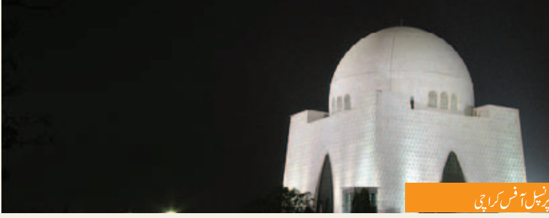
پرنسپل آفس کراچی