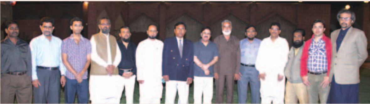
سی ڈی کے کارکنان و افسران کا گروپ فوٹو