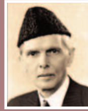
قائد اعظمؒ نے فرمایا

حضرت ابن عباسؓ سے روایت ہے کہ نبی صلی اللہ علیہ وسلم نے ارشاد فرمایا: چار چیزیں جس شخص کو مل جائیں تو اسے دنیا اور آخرت کی بھلائی مل گئی۔ 1- اللہ کی نعمتوں پر شکر سے معمور دل 2- اللہ کا ذکر اور چرچا کرنے والی زبان 3- مصیبتوں کو سہنے والا جسم 4- ایسی بیوی جو شوہر کے مال کی حفاظت کرتی اور پاک دامن رہ کر زندگی گزارتی ہے۔ (تذغیب و ترتیب)