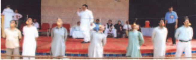
ایپل بائیٹ مقابلہ میں کھلاڑیوں کی کاوش کا ایک منظر