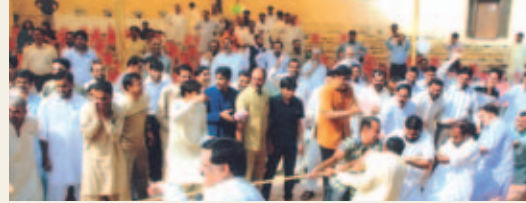
زون کے مابین رسی کشی کے مقابلہ کا منظر