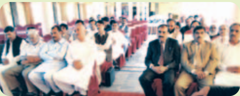
شرکا، عیدلن پارٹی

گزشتہ دنوں کاروباری اہداف کے حصول کو ہر صورت ممکن بنانے کے لیے انعامی مقابلے عیدلن پارٹی کا اعلان کیا گیا تھا جس میں کامیاب فیلڈ کارکنان کے اعزاز میں ایک خوبصورت تقریب مقامی ہال میں منعقد کی گئی۔ اس تقریب کے مہمان