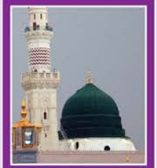
فرمان رسول ﷺ

حضرت جابر رضی اللہ تعالیٰ عنہ سے روایت ہے کہ رسول اللہ ﷺ نے فرمایا کہ تم لوگوں میں میرے زیادہ پیارے اور قیامت کے دن میرے بہت قریب بیٹھے والے وہ لوگ ہیں جن کے اخلاق اچھے ہیں اور تم لوگوں میں میرے بڑے دشمن اور قیامت میں مجھ سے بہت دور بیٹھے والے وہ لوگ ہیں جو بڑے باتوئی اور بڑا مارنے والے اور منہ دراز ہیں۔ (ترمذی)