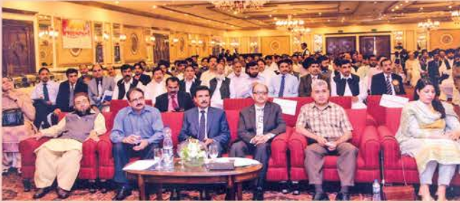
تقریب کے شرکاء۔