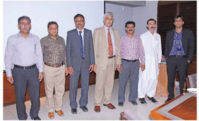
وزیراعظم پاکستان ہیلتھ انشورنس اسکیم کا نینڈر حاصل کرنے پر اسٹیٹ لائف کے صدر دفتر میں ایک کانے کی تقریب کے شرکاء۔