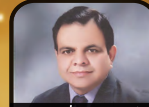
ایس۔ جی۔ ایم ربانی۔ اسلام آباد Rs. 50,070,015

اسٹیٹ لائف انشورنس کارپوریشن آف پاکستان کو اپنے ان پر عزم اور جفاکش ایریا مینیجرز پر ناز ہے جنہوں نے انتھک محنت اور بے لوث خدمت سے نہ صرف شہروں میں بلکہ دور دراز کے دیہاتوں میں بسنے والے اہل وطن کو بیمہ زندگی کے ذریعے معاشی تحفظ فراہم کیا اور اس کے ساتھ ملک کی ترقی میں اور اپنے ادارے کی ترقی میں نہایت اہم کردار ادا کیا اس اعلیٰ اور قابل تقلید کارکردگی پر ہم ان تمام ایریا مینیجرز کو خراج تحسین پیش کرتے ہیں۔