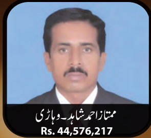
ممتاز احمد شاہد۔ وہاڑی Rs. 44,576,217

ایک ریکارڈ ساز کامیابی ان ہی کی بے مثل کارکردگی کا ثبوت ہے