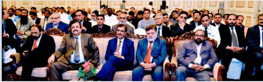
میٹنگ کے شرکاء

پریمیم کر رہا ہے آپ نے سنا ہوگا کہ مائیکل جارڈن کی ماہانہ آمدنی دو کروڑ ڈالر تھی جبکہ وہ 2 سے 20 ڈالر کی شرٹ بیچتا تھا آپ زیادہ سے زیادہ فروخت کریں اچھی آمدنی حاصل کریں اس پلیٹ فارم سے اعلان کرتا ہوں کہ کوٹہ 5 فیصد بڑھے گا جو چیز میں سے منظور کروالیے جائیں گے۔ جی ایم نے لعرہ دیا کہ جمع یا تفریق نہیں پریمیم کو ضرب دیں گے۔