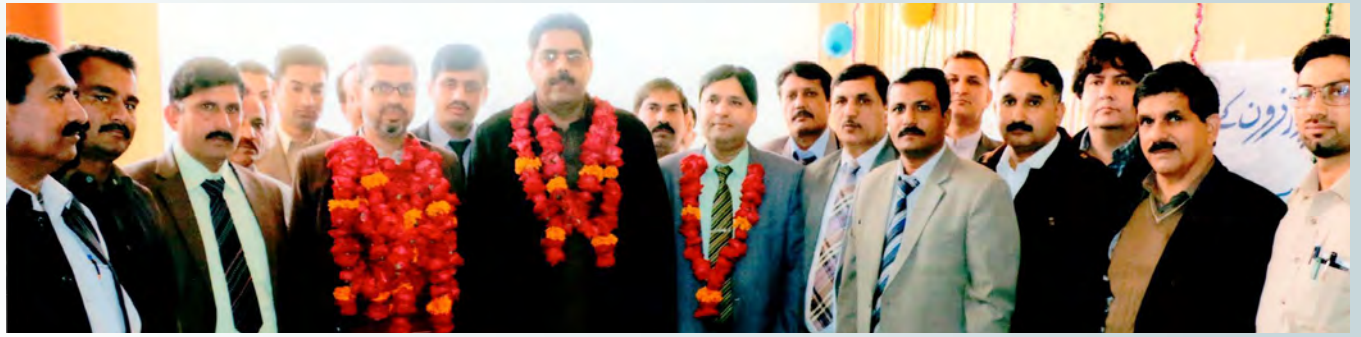
یزمان میں سیکر آفس کے افتتاح کے موقع پر فیلڈ کے ساتھیوں کے ساتھ گروپ فوٹو