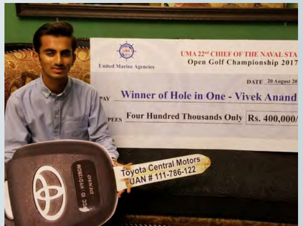
گیان چند ڈویژنل ہیڈ بینک انشورنس کے صاحبزادے جنہوں نے 22 ویں یو ایم اے چیف آف ڈائریول اسٹاف گولف چیمپئن شپ میں چار لاکھ روپے اور گاڑی جیتی